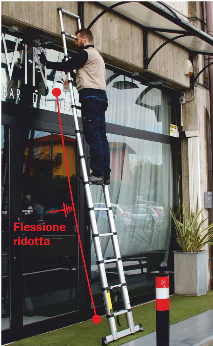
In foto articolo SCA EXTEL/13

Profili più robusti garantiscono una flessione ridotta in posizione uso